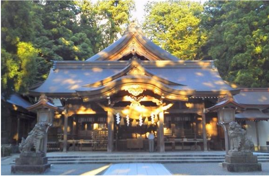
白山比咩神社幣拝殿(本殿)